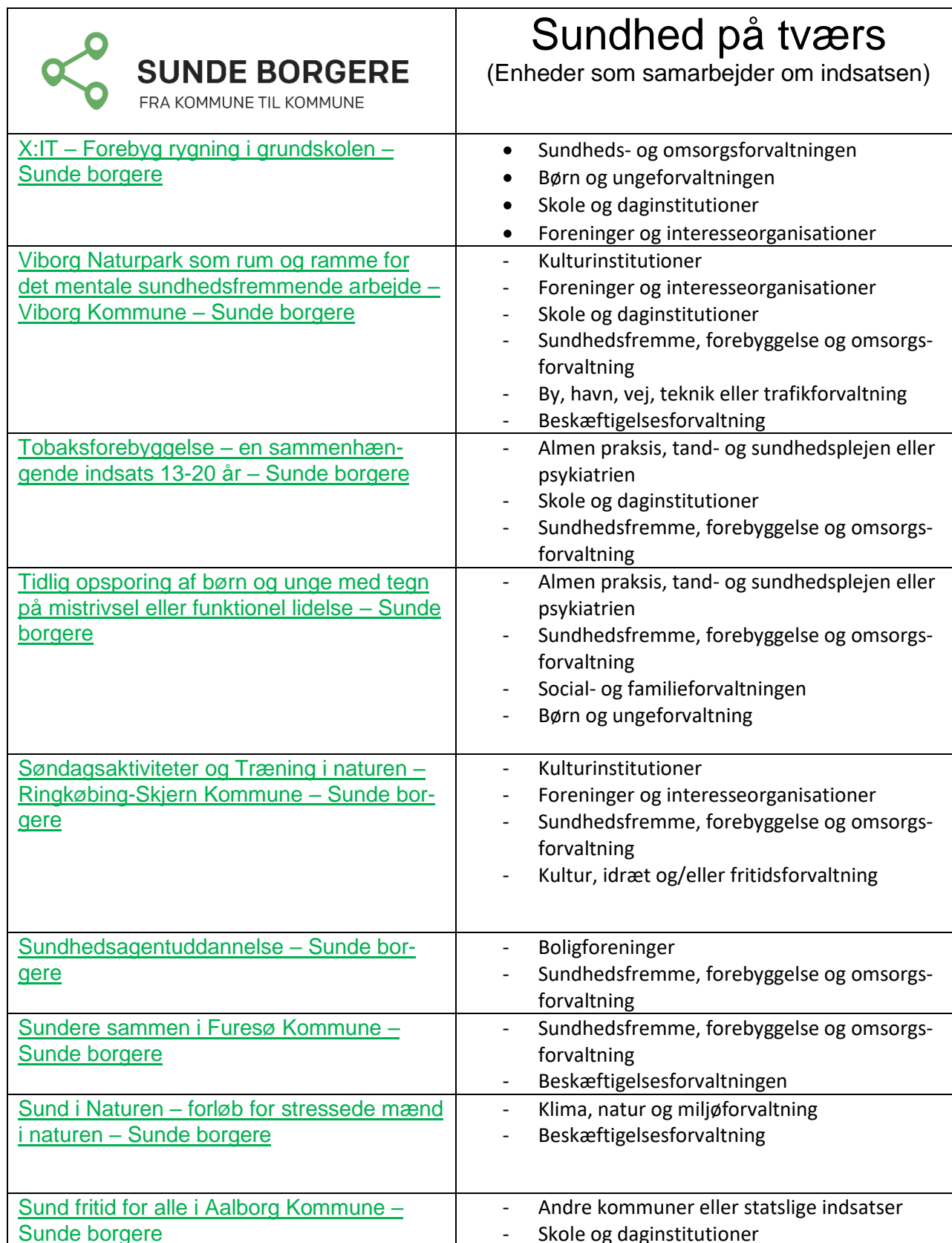
Figur 2 – Inkluderede cases og overblik over enheder som samarbejder om indsatsen